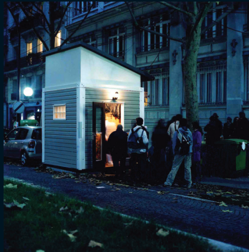
N° 3 VILLE ET FICTION – CHRONOCLUB , GROUPE ICI-MÊME