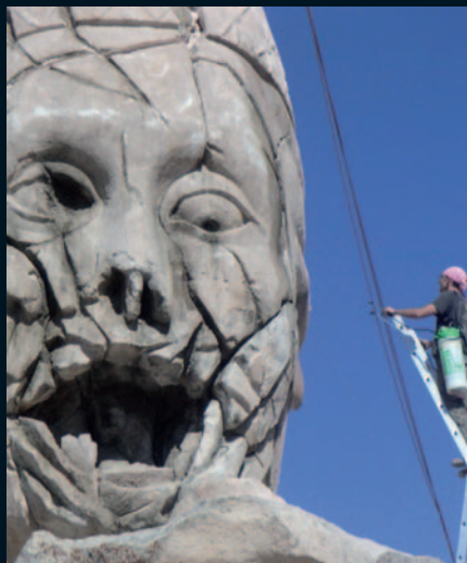
N° 5 GÉANT ET ŒUVRE MONUMENTALE L'EMPIRE DES LOUPS , GUY-CLAUDE FRANÇOIS