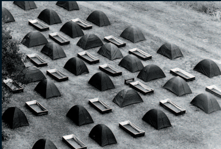
N° 4 L'INVENTION DU SPECTATEUR LA MASTICATION DES MORTS , GROUPE MERCI