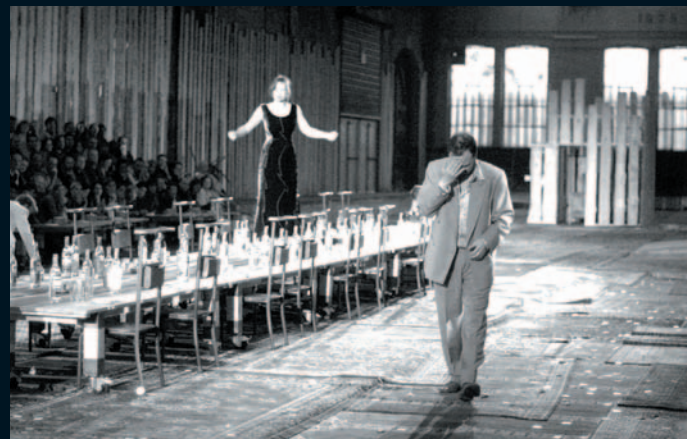
N° 6 RITUELS DIONYSIAQUES ET CONTEMPORAINS – LES NOCES/SVADEBKA/ LE MARIAGE , WALPURGIS/DE ROOVERS/HET SPECTRA ENSEMBLE