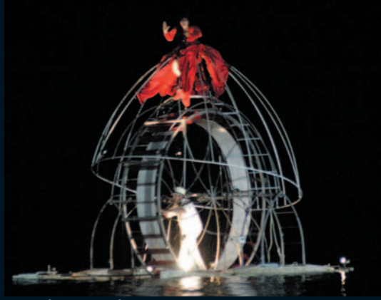
N° 1 SCÈNES D'EXTÉRIEUR – CONFINS , CIE ILOTOPIE