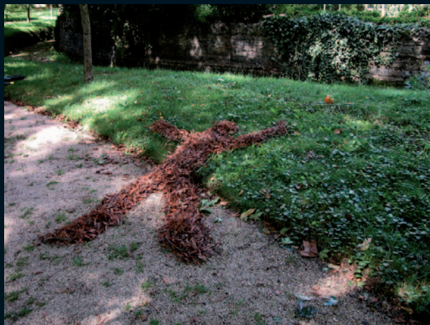
N° 2 LA NATURE DÉCOR OU SUJET – MARCHE, DANSES DE VERDURE , CIE ASTRAKAN