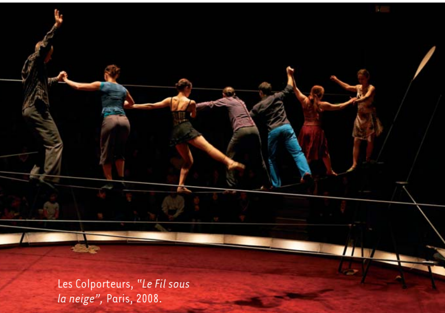
Les Colporteurs, "Le Fil sous la neige", Paris, 2008.