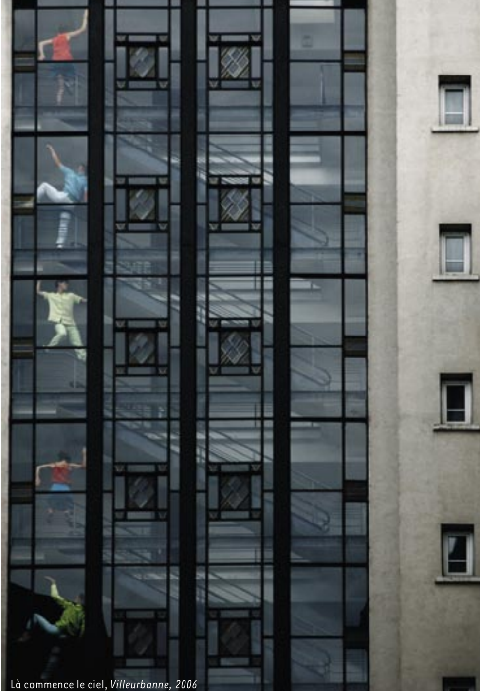
Là commence le ciel, Villeurbanne, 2006

« Si je veux parler d'un lieu, (...) il faut aussi que je vive là, que je comprenne l'histoire, le sens actuel de l'endroit... »