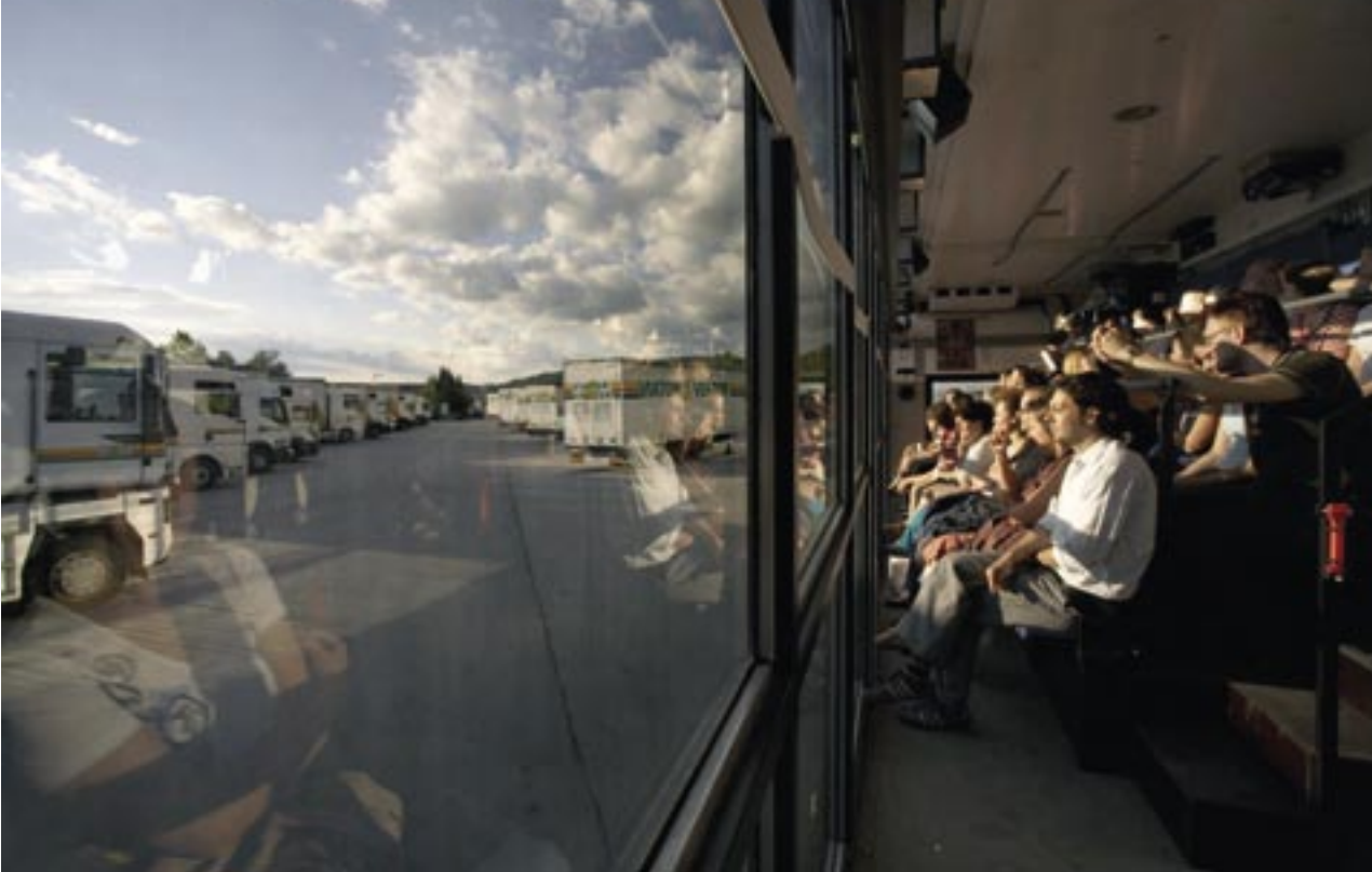
En 2006, à bord du Cargo Sofia-Ljubljana, les spectateurs-passagers sont embarqués dans le "théâtre de route" de Stefan Kaegi.

laboratoire dont il explore « le potentiel plastique et culturel » – en déplaçant une série d'objets urbains emblématiques, en créant des panneaux d'affichage atypiques... Également à l'écoute de la ville et de ses métamorphoses, le collectif d'architectes et d'artistes Pixel 6 a conçu le Bulb : une demi-sphère posée sur une place publique où sont projetés images et sons captés et remixés pendant deux semaines d'immersion dans un quartier ou un village.