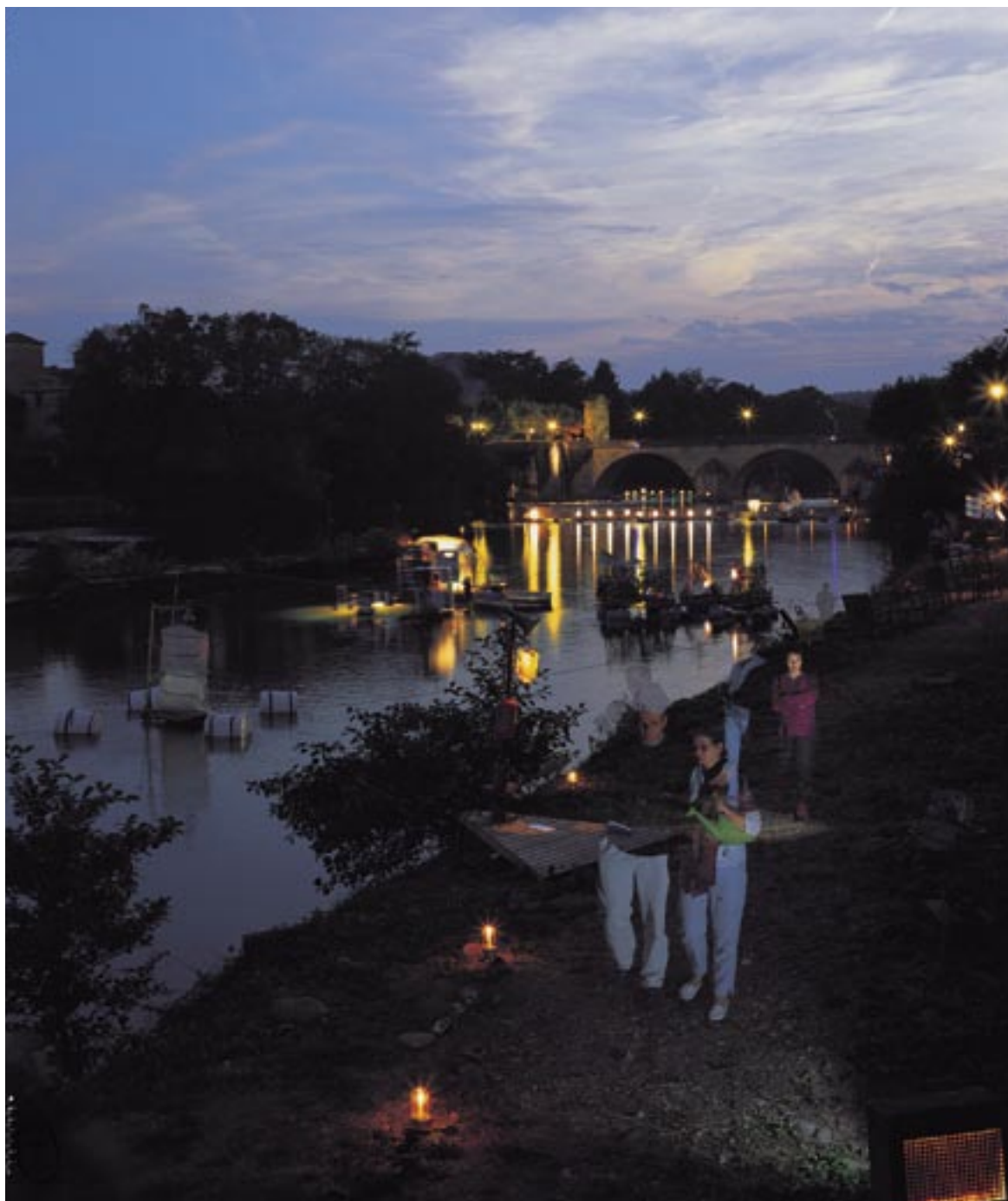
Le Roman fleuve de KMK, à Saint-Martory en 2003.