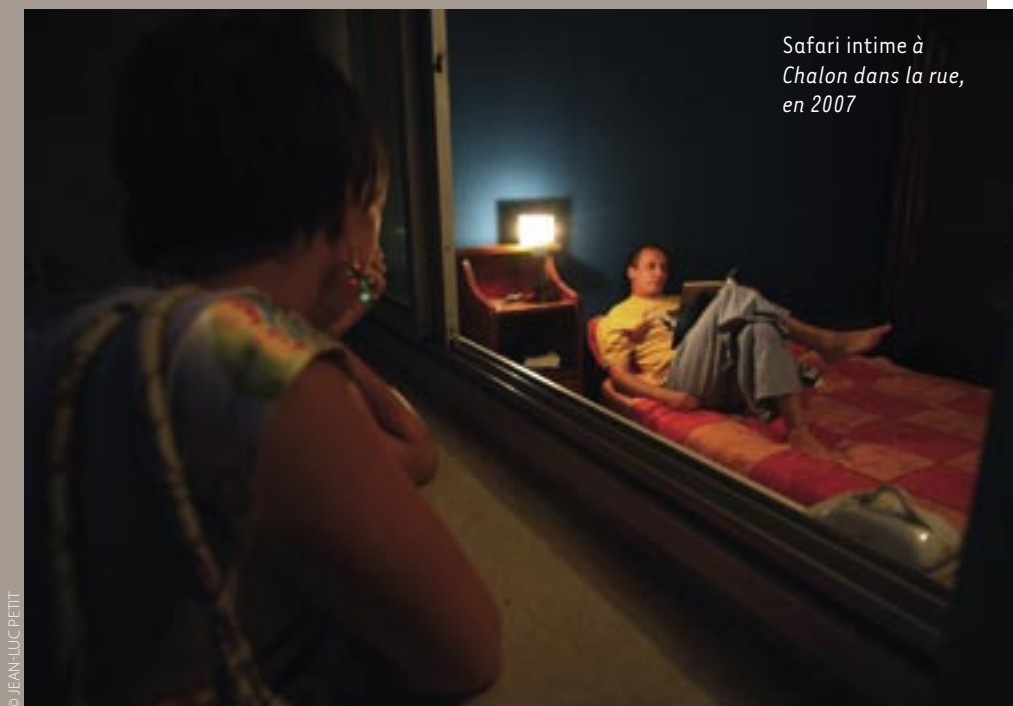
Safari intime à Chalon dans la rue, en 2007