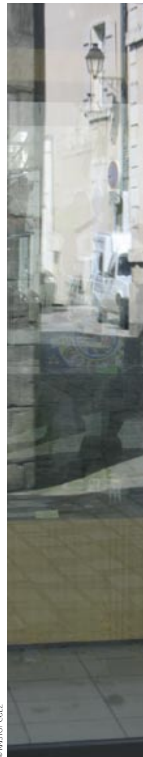
Noyade interdite, par la compagnie Ici Même (Paris).

Car le débat sur les territoires met vite en lumière la contradiction du politique, entre l'obsession de laisser une trace bâtie et l'angoisse de l'élus face aux fauteuils vides. Dans ce contexte, les arts de la rue